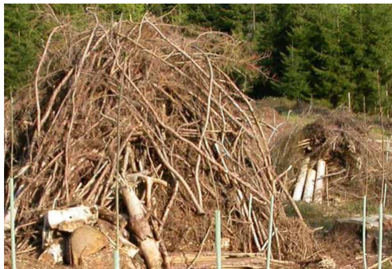
Asthaufen sind ökologisch wertvoll und verrotten innerhalb von wenigen Jahren.